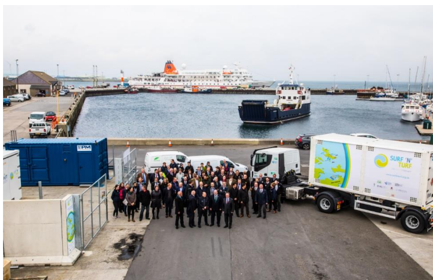
Destination Kirkwall : le ferry qui relie actuellement Shapinsay à Kirkwall avec la liaison choisie pour le projet HYSEAS III au second plan. HYSEAS III sera associé au projet énergétique à partir d'hydrogène Surf 'n' Turf pour fournir une installation d'approvisionnement en hydrogène au navire de remplacement

Une fois les tests réalisés avec succès, le navire pourra être construit, en ayant déjà l'assurance qu'il peut naviguer efficacement et en toute sécurité dans les eaux écossaises, où la navigation est difficile. Ce navire doit naviguer entre les Orcades et aux environs - où sont déjà produites de grandes quantités d'hydrogène par électrolyse lorsque l'électricité de sources renouvelables dépasse les capacités du réseau, opération sans laquelle cette énergie serait perdue.