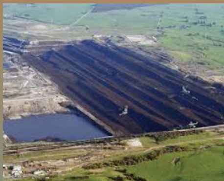
■ Mines de Lignite Etat de Victoria

susceptibles par exemple d'alimenter le Japon en Hydrogène pendant 250 ans, ou par reformage du gaz naturel assisté éventuellement par énergie solaire, capture et stockage du CO 2 à environ 80 km du lieu de production. Le projet CarbonNet soutenu à la fois par le gouvernement australien, celui de l'Etat de Victoria et du gouvernement japonais via le Nedo, vise à gazéifier une lignite très chargée en eau (60%) et qui ne trouve aucun débouché actuellement car trop coûteuse à transporter. Le projet en est à la phase de conception. Une démonstration devrait être lancée en 2020.