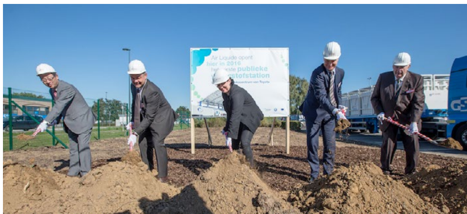
■ Pose de la 1ère pierre d'une station de recharge d'hydrogène à Zaventem