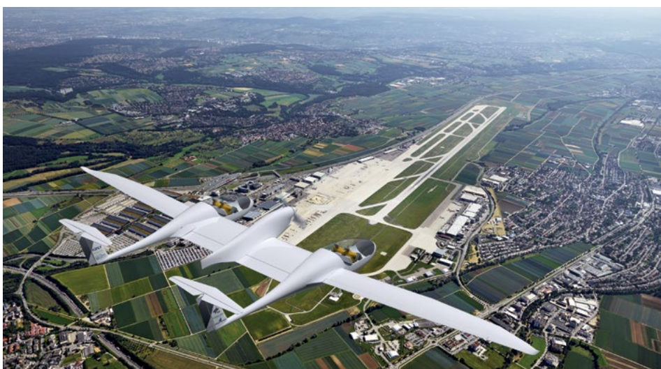
■ Image du futur Hy4