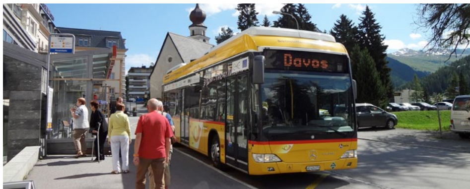
■ Un bus hydrogène de CarPostal à Davos

Du 12 au 16 octobre 2015, la société suisse Car Postal, opérateur de bus et exploitant de bus à pile à combustible dans le cadre du projet européen CHIC, était en tournée en France. De Salon-de-Provence à Belfort, avec des étapes à Bourg-en-Bresse, Grenoble et Dole, le Road Show a permis à Car Postal de présenter un bus à hydrogène. A cette occasion, la filiale française a fait le point sur les applications liées à la mobilité, notamment les avantages à utiliser une telle technologie