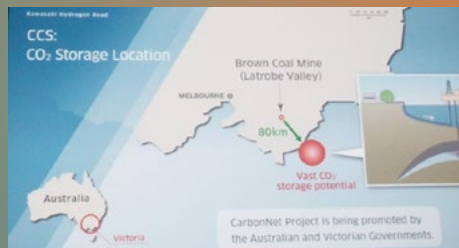
■ Stockage géologique du CO 2 en mer