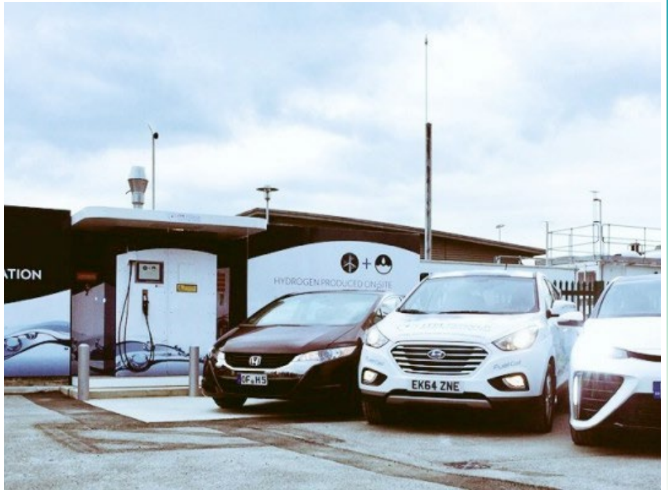
■ La station d'ITM Power

La station propose actuellement uniquement de l'hydrogène gazeux à 350 bars, mais devrait profiter d'une mise à jour afin de pouvoir fournir de l'hydrogène à 700 bars dès le début de l'année 2016.