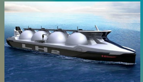
■ Transport d'hydrogène Liquide (MHI)