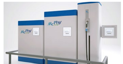
■ La station McPhy pour Lyon

Européenne dans le cadre du FCH-JU. La station sera livrée au second semestre 2016 à la Communauté d'Agglomération Sarreguemines Confluences (CASC), son exploitant. Elle est au cœur du projet FaHyence porté par la CASC, territoire à énergie positive pour la croissance verte, dans le cadre de son plan Climat en partenariat avec McPhy Energy, EDF, l'institut EIFER (European Institute for Energy Research, laboratoire commun entre EDF et l'Université de Karlsruhe en Allemagne), l'association Alphéa Hydrogène et Haskel. Ce projet prévoit le déploiement de 11 véhicules utilitaires Renault Kangoo ZE-H2 hybrides batterie / hydrogène (HyKangoo) autour de cette station.