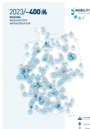
■ Il le réseau des stations H2 en Allemagne à l'horizon 2023

Daimler, Total Deutschland GmbH, Octobre 2015