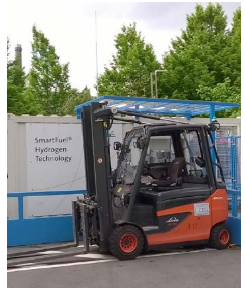
■ Un chariot à pile à combustible, Linde MH