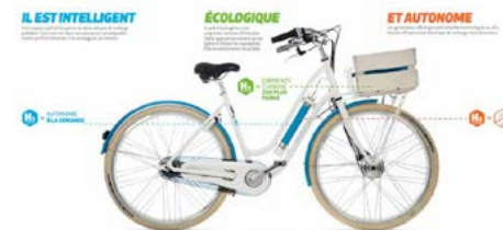
■ L'Alterbike à H2 de Cycleurope