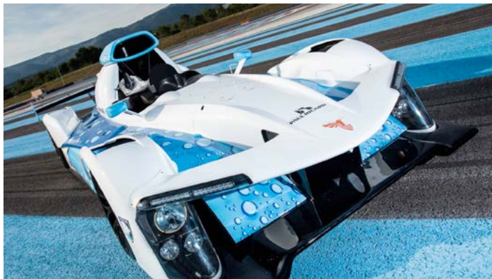
■ Première Mondiale au Circuit Paul Ricard

À l'occasion de la manche Française du Championnat du monde WTCC qui s'est déroulé ce week-end au Circuit Paul Ricard, le public a pu découvrir en avant première mondiale la GreenGT H2, voiture de course électrique-hydrogène.