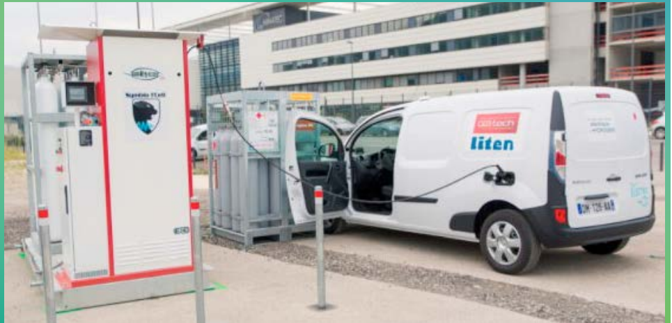
■ La station de symbiofcell

Les véhicules aux couleurs de leurs clients utilisateurs ont été présentés chez Auto-Losange, concession Renault à Fontaine ce 10 juin 2015.