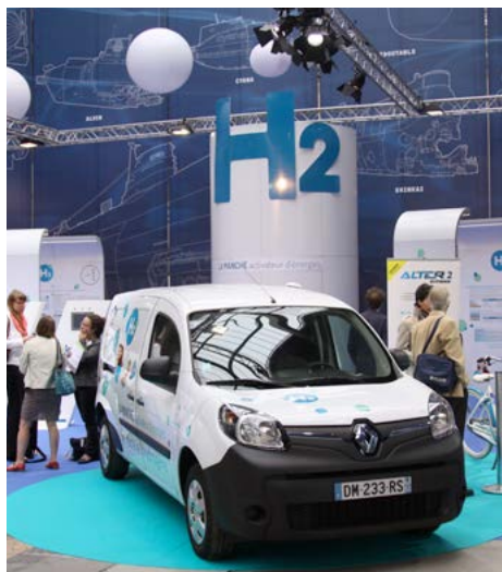
■ Exposition Hydrogène organisée à la Cité de la Mer de Cherbourg dans le cadre des Journées Hydrogène dans les territoires

Ce modèle n'est pas encore produit en série, mais en cas de retours positifs, l'industrialisation pourrait intervenir prochainement. Cependant Cycleurope a déjà vendu 17.000 vélos à assistance électrique au groupe La Poste! Ce marché a connu une croissance de 25% par an durant les dix dernières années.