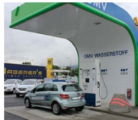
■ La nouvelle station Linde / OMV

Après Stuttgart et Vienne, cette station est la troisième pour le distributeur de carburant autrichien.