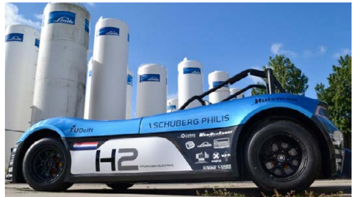
■ La Forze VI

La Forze VI est une voiture à pile à combustible mise au point par des étudiants de l'université technique de Delft aux Pays-Bas. Pilotée par Jan Lammers, un ancien vainqueur des 24h du Mans, elle a battu de plus de 1 minute le record du tour sur le circuit du Nürburgring pour une voiture à hydrogène, qui était détenu par la Nissan X-Trail FCV. Elle a bouclé le tour en 10 minutes et 42 secondes.