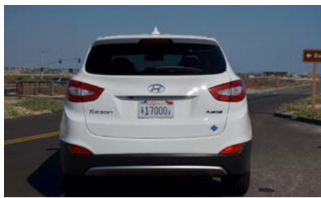
■ Hyundai Tucson Hydrogen, munie d'une plaque d'immatriculation californienne

Hyundai Canada a livré 2 Hyundai Tucson EV 2015 à hydrogène, plus connu en Europe sous le nom de Hyundai ix 35 FCEV. Disponible à la location pour un montant de 529 dollars canadien (environ 380 euros) par mois, le constructeur sud-coréen espère en écouler entre 10 et 20 unités par an dans ce pays.