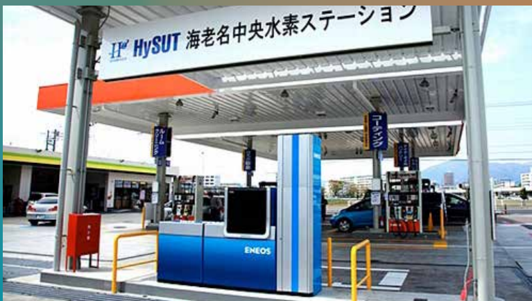
■ Une pompe à hydrogène intégrée dans une station traditionnelle à Kanagawa

Toyota vient également de lancer une levée de fonds et un partenariat avec Mazda. D'après une information du site économique Bloomberg, Toyota aurait lancé un plan de 4,2 milliards de dollars pour financer la recherche sur les piles à combustible. Ce financement prendrait la forme de 150 millions d'actions de catégorie AA émises, et dont les revenus seront dédiés spécifiquement à ce domaine. Les actions seront même vendues avec