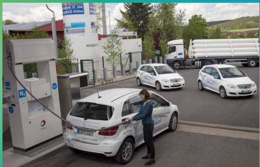
■ La station de Total Autohof Geiselwind avril 2015

Pour ce faire, Total a investi à Geiselwind plus de 250 000 euros, pour la construction, les procédures d'autorisation ainsi que dans la gestion du projet, les services et la maintenance des composants.