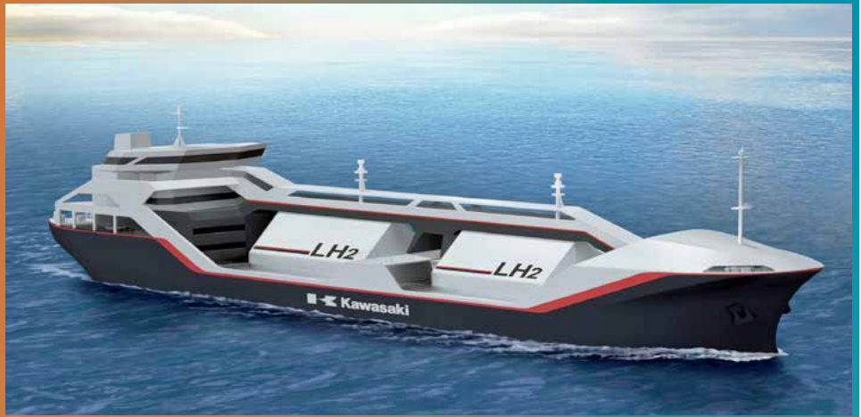
■ Design du navire transportant de l'hydrogène liquide © Mercator Media 2015

Ainsi le Japon à travers les mesures gouvernementales et les programmes des entreprises est engagé sur l'étude et l'évaluation de plusieurs projets d'envergure. En exemple, on citera le groupe Kawasaki Heavy Industries qui envisage notamment deux types de projets pour la production d'hydrogène hors du Japon et son transport sous forme liquéfiée par bateau. Dans l'un de ces projets, il s'agira de produire l'hydrogène en utilisant les grandes quantités de lignite en Australie avec stockage du CO 2 . Dans l'autre, il s'agira de produire l'hydrogène par électrolyse via des éoliennes off-shore notamment en Norvège.