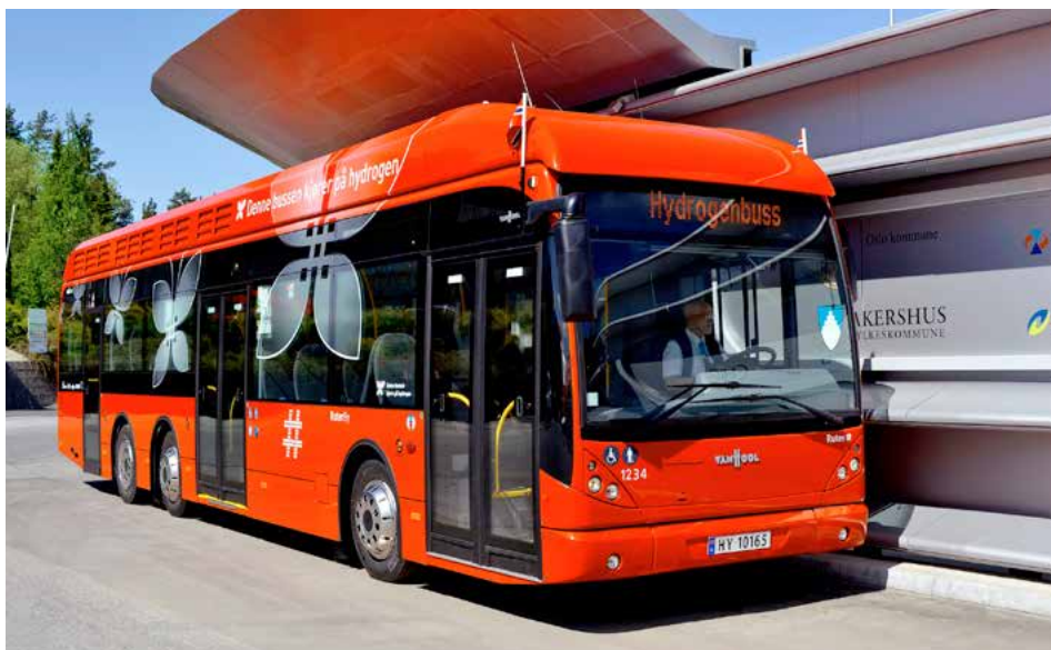
■ Bus à pile à combustible VanHool à Oslo