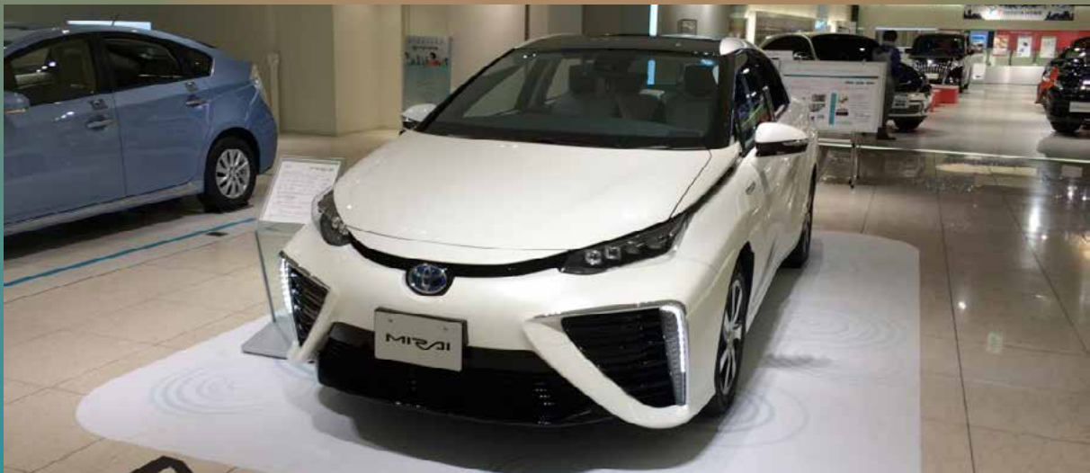
■ Toyota Mirai

Hormis Toyota, Honda a également annoncé la commercialisation d'un véhicule à hydrogène, mais pas avant la fin de l'année 2015. Ce qui laissera au Japon plus de temps pour déployer son infrastructure de recharge en hydrogène. Car le pays est en retard sur ses prévisions, malgré les différents programmes et initiatives d'installations. Alors que le plan prévoyait 100 stations hydrogène pour mars 2016, au plus tard, seuls 76 dossiers ont été déposés à temps pour une demande de financement gouvernemental d'un montant de 50 %. Au Japon, une station est estimée à environ 5 millions de dollars. A noter que le gouvernement japonais a investi 178,37 millions de dollars sur les 3 dernières années pour le déploiement de ces 100 stations.