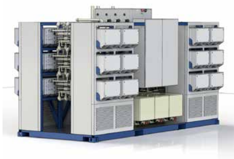
■ Un système AFC Energy