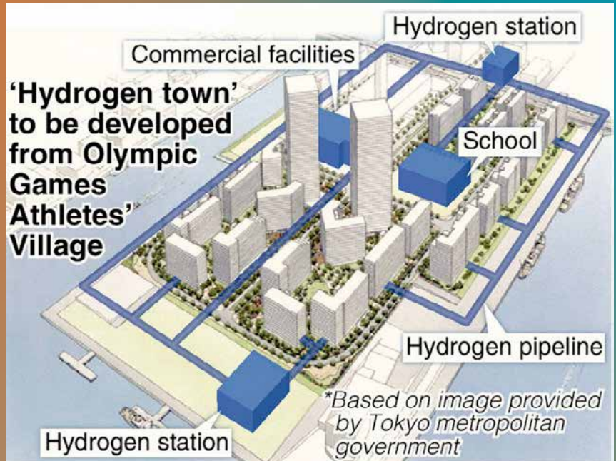
■ Village Olympic Tokyo 2020

un escompte d'environ 20 % sur le prix des actions ordinaires. Offertes sur une période de cinq ans, celles-ci procureront un dividende ainsi que la possibilité de les revendre au prix de l'émission à la fin du terme ou de les convertir en actions ordinaires. Objectif : assurer un financement à long terme de la part des investisseurs pour mener les développements nécessaires au projet. Les 50 premiers millions d'actions seront vendues une fois le plan adopté lors de la rencontre des actionnaires en juin prochain. Les autres actions seront vendues plus tard, mais aucune date n'a été indiquée. Dans un récent communiqué de presse, Toyota annonce bien ce plan, et indique qu'il servira à financer la R&D pour le déploiement de technologies plus propres, mais l'hydrogène et la pile à combustible ne sont pas cités. Quant au partenariat avec Mazda, il a pour but un échange de technologie : Toyota fournirait à Mazda sa technologie pile à combustible en échange de moteurs essence et diesel.