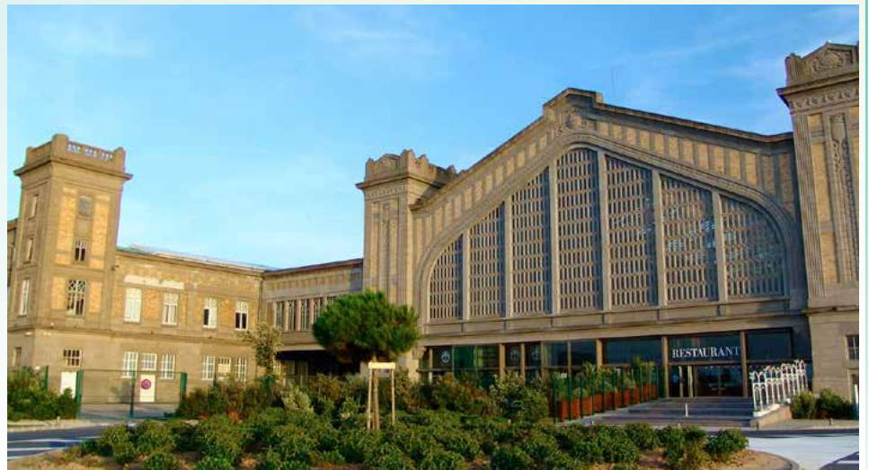
■ Cité de la Mer de Cherbourg

Une dizaine de territoires présenteront leurs projets et leurs initiatives au cours de la première journée qui se terminera par une table ronde sur la maîtrise du risque et l'acceptabilité sociétale des technologies de l'hydrogène.