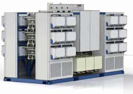
■ Un système AFC Energy

AFC Energy le fabricant de pile à combustible alcaline a signé un accord avec la société Dubaï Carbon en vue de la commercialisation et l'installation de piles stationnaires à Dubaï. Le protocole d'accord fixe un cadre de coopération qui va permettre de déployer d'ici à 2020 des piles à combustible alcalines d'une puissance totale de 300 MW.