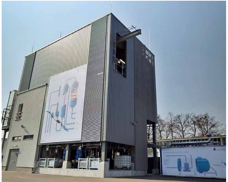
■ Le Pilote de Sunfire