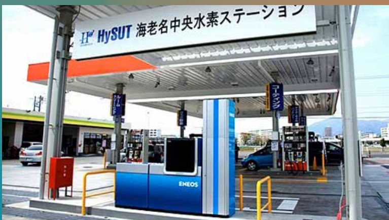
■ Une pompe à hydrogène intégrée dans une station traditionnelle à Kanagawa

Toyota vient également de lancer une levée de fonds et un partenariat avec Mazda. D'après une information du site économique Bloomberg, Toyota aurait lancé un plan de 4,2 milliards de dollars pour financer la recherche sur les piles à combustible. Ce financement prendrait la forme de 150 millions d'actions de catégorie AA émises, et dont les revenus seront dédiés spécifiquement à ce domaine. Les actions seront même vendues avec